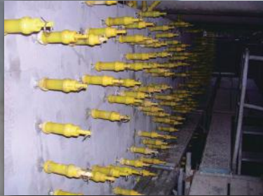
ひび割れ注入 (低圧注入工法)

プロコン40は内部圧入工法・ひび割れ注入工・表面保護工・断面修復工において、より亜硝酸リチウムが浸透拡散するように改良された亜硝酸リチウムです。