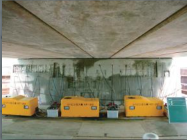
内部圧入工 (ASRリチウム工法)